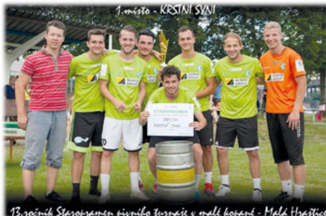
13.ročník Staropramen pivního turnaje v malé kopané - Malá Hraštica

Zúčastněná mužstva na turnaji: Krstní syni, Disco Stars, EFCÉ, Gambleři, KEHO, Kentauři, Pobřeží kocoviny, Slovanka, Dorost Hraštica, Young Boys, Hofi Team, Betonáři, Viš, Chlumecká kapela, Dream Team, Fešáci ve vatě, Vyšehradští jezdci, Slavoj Příbram, Sem tam brnk.